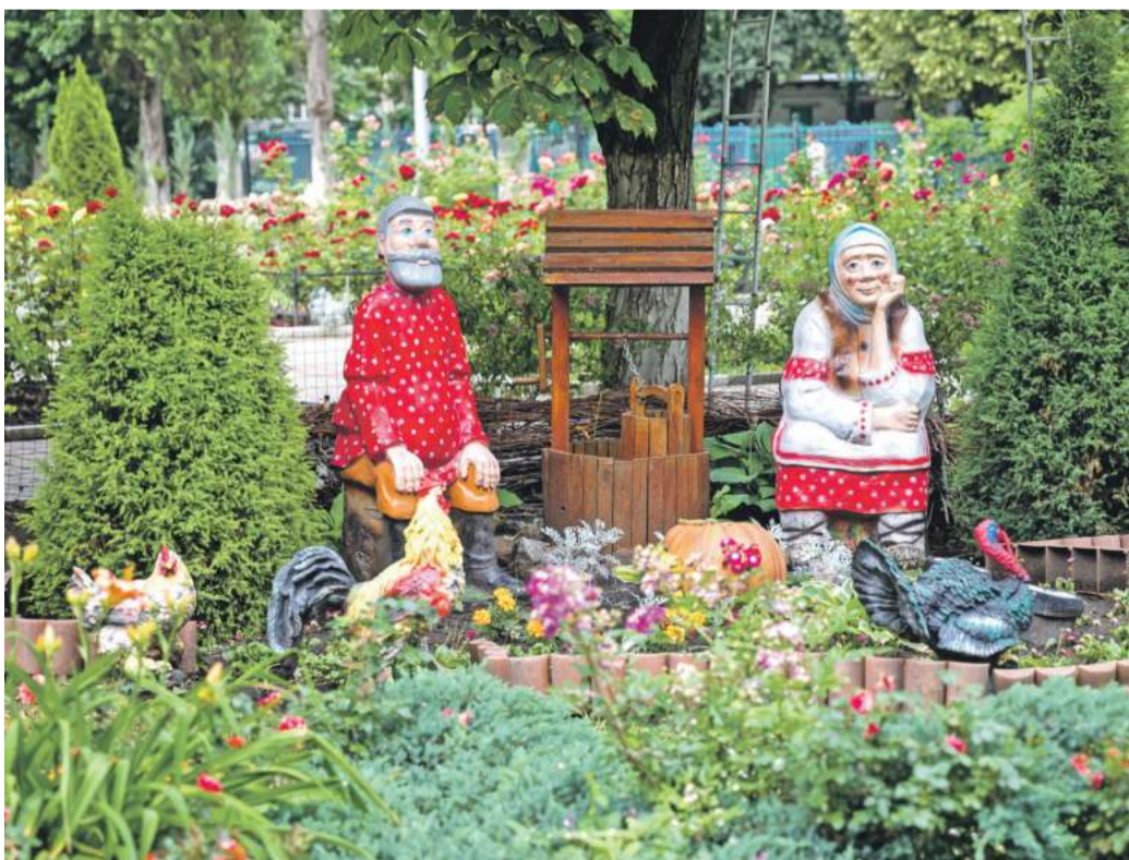
Школа № 41 г. Белгорода