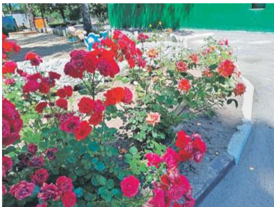
Детсад № 48 «Вишенка» г. Белгорода