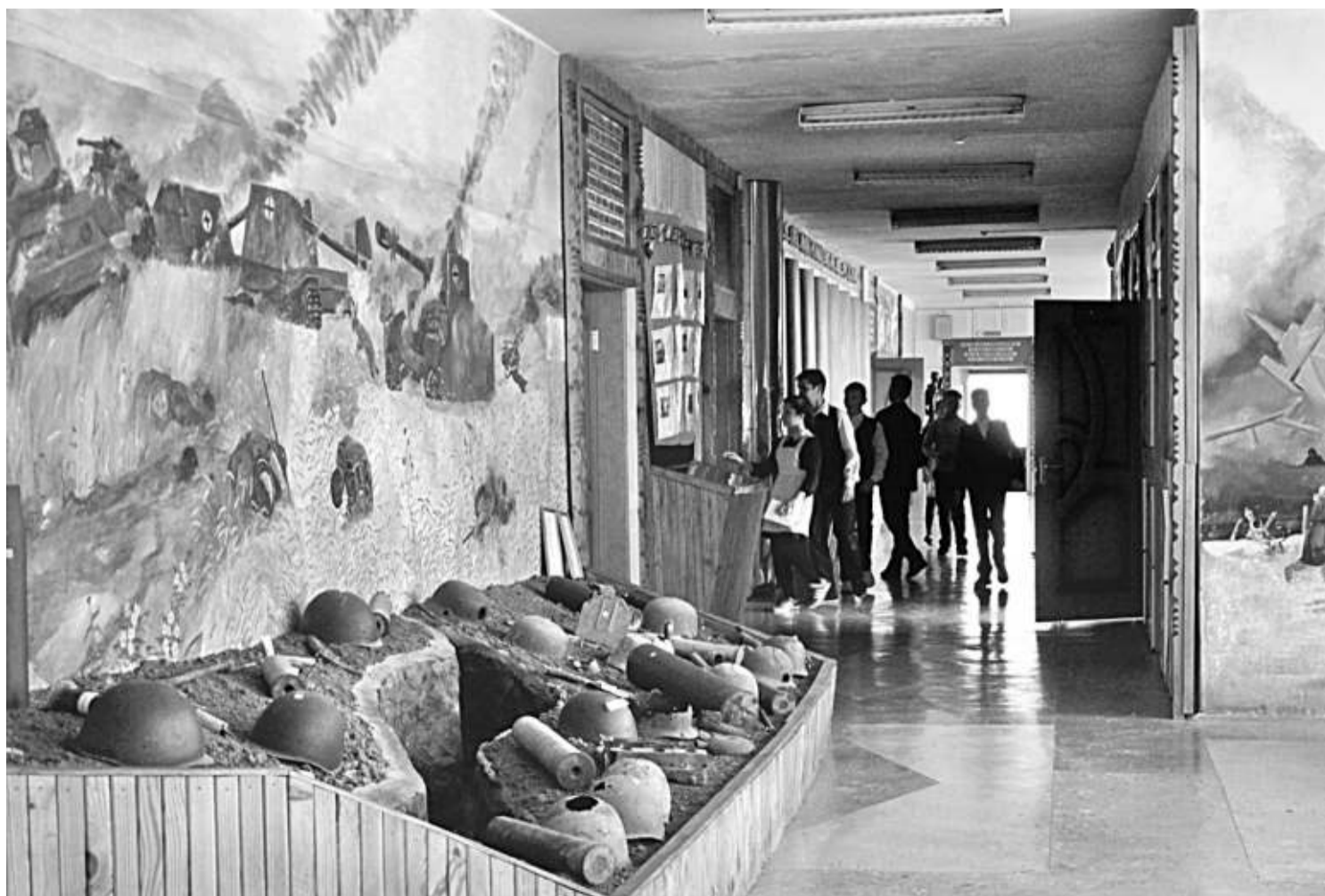
Школьный музей Великой Отечественной войны