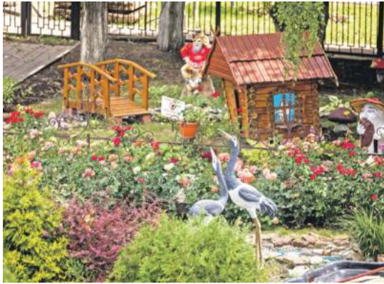
Школа № 41 г. Белгорода