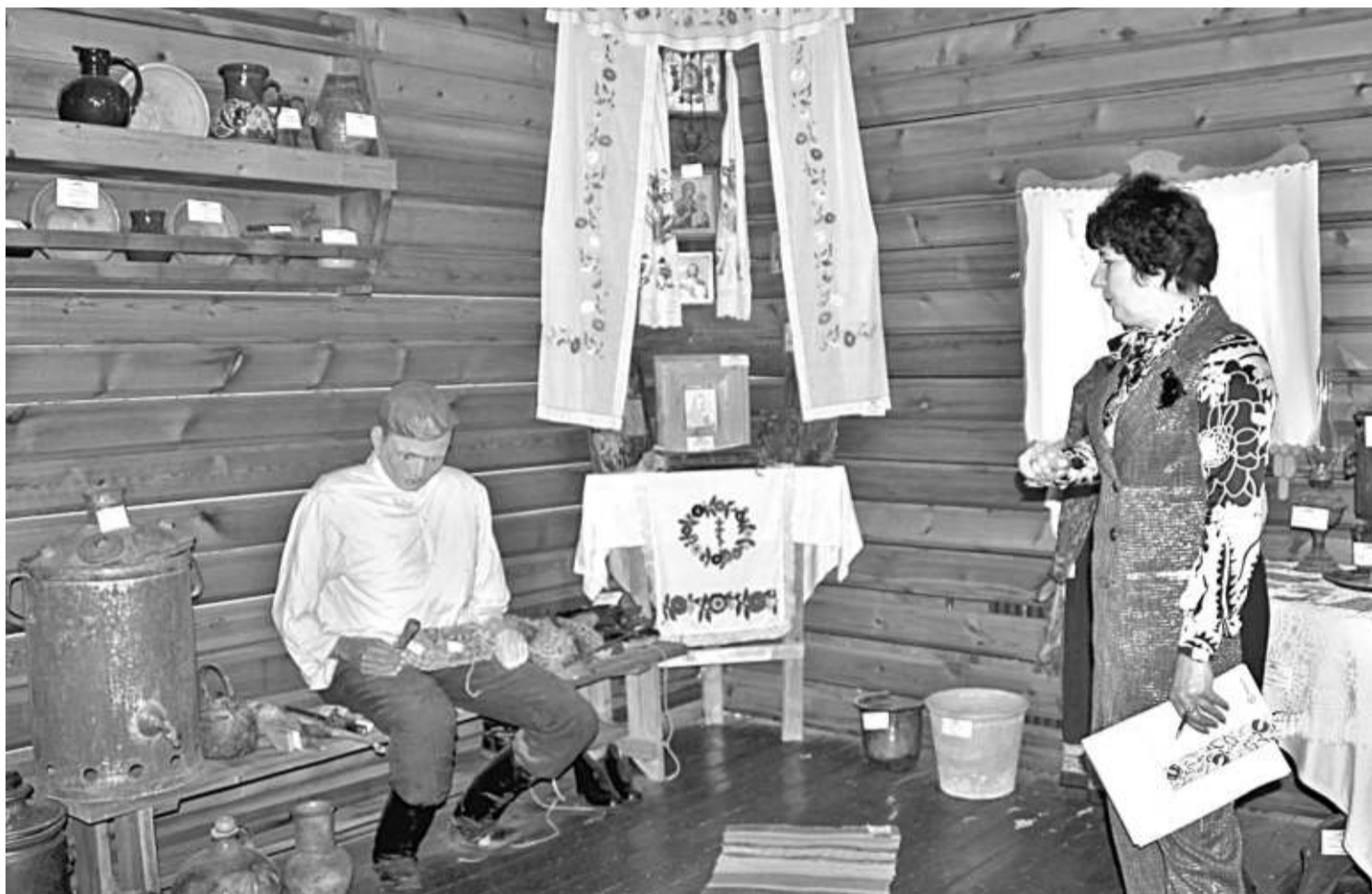
В школьном музее этнографии

НО ДАЖЕ САМОЕ КРАСИВОЕ, ПУСТЬ И ДОБРОЖЕЛАТЕЛЬНОЕ ОФОРМЛЕНИЕ МОЖЕТ СТАТЬ БЕСПОЛЕЗНЫМ, БЕЗДЕЙСТВЕННЫМ,