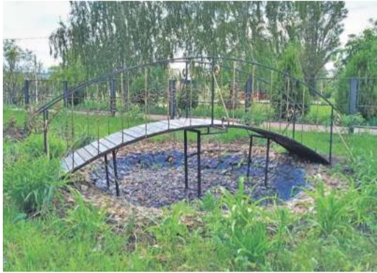
Уразовская школа № 2 Валуйского городского округа