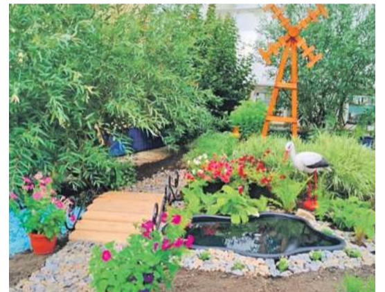
Рождественская школа Валуйского городского округа