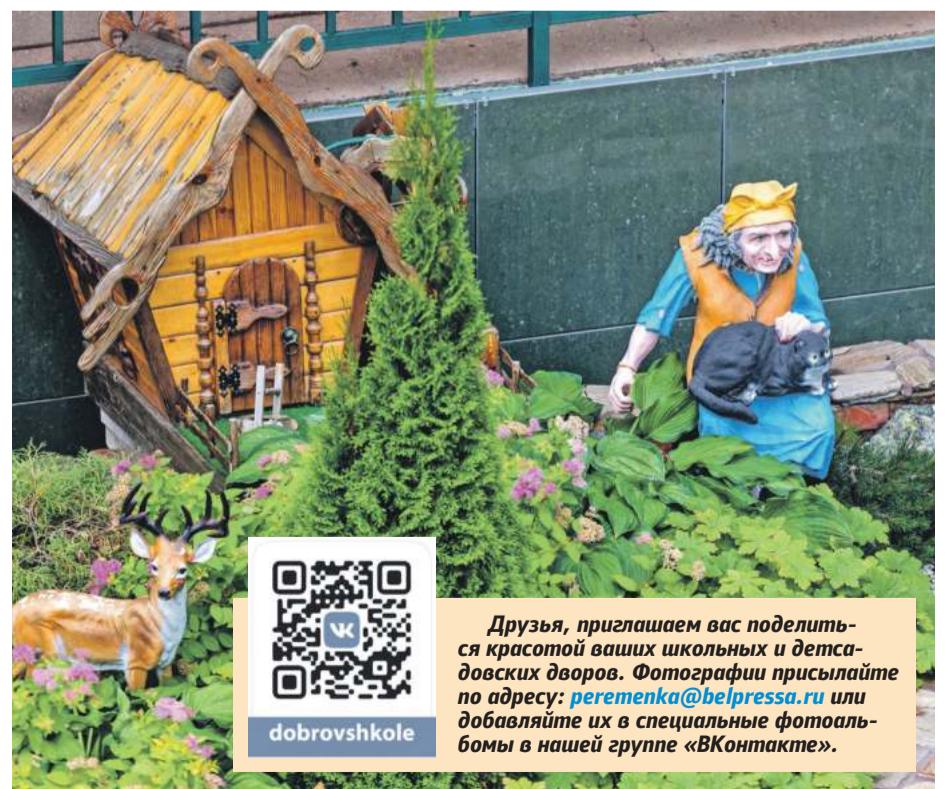
Школа № 41 г. Белгорода