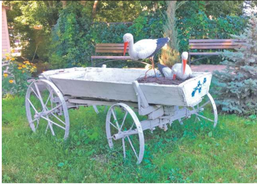
Центр образования № 1 г. Белгорода