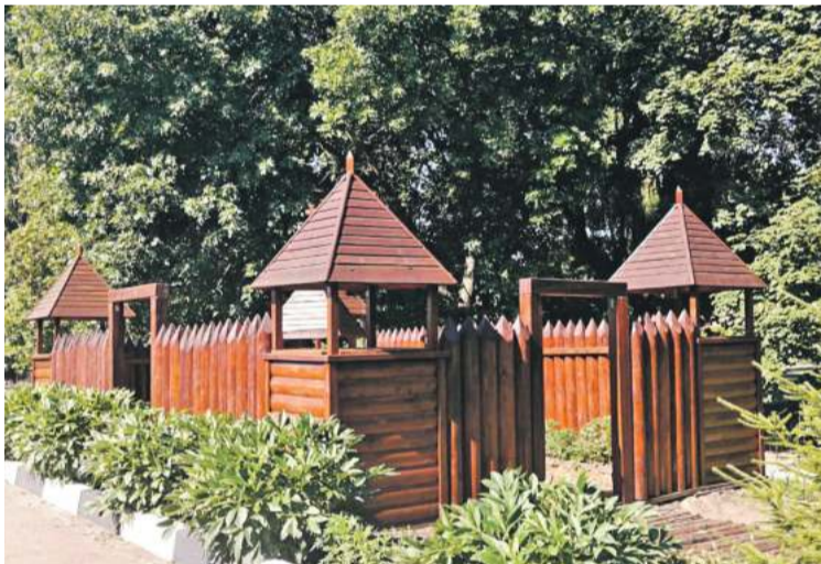
Школа № 4 г. Валуйки

Школа начинается со школьного двора. От того, как он обустроен, зависит многое. Настроение ребят и учителей. Их желание идти в школу. Адаптация первоклассников к учебной жизни. Недавно на Белгородчине уже много лет проводят конкурсы на лучшее обустройство школьных территорий. Если к делу подойти с душой, то школьный двор можно превратить и в ботанический, и в сказочный сад, и в обучающее пространство. В группе «Доброжелательная школа Белогорья» в соцсети «ВКонтакте» мы попросили учителей и учеников поделиться с редакцией фотографиями дворов их школ. И детских садов. Давайте вместе полюбуемся на нашу школьную красоту! Ну и в нашем редакционном портфеле кое-что нашлось.