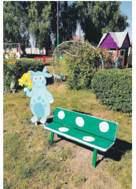
Детсад № 4 с. Алексеевка Корочанского района