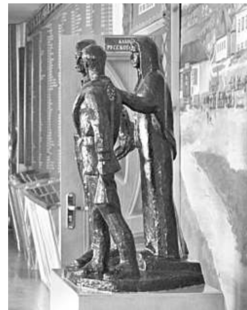
Школьный музей Великой Отечественной войны

Уверена в том, что в школе всегда ведущей и главной должна быть функция воспитания, ответственности за формирование человеческой личности. В детях необходимо формировать нравственные принципы, делая это незаметно и каждодневно. В нашей школе детей и педагогов связывают