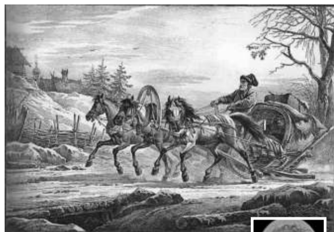
Настоящая кибитка — это крытая повозка, как на этой литографии Александра Орловского «Путешественник в кибитке, или Сани, запряжённые тройкой» (1819, Киевская картинная галерея)

Другие ученики назвали кибитку «птичкой», летящей с Кубы и крыльями поднимающей снег; «поездом, который очень быстро едет, и поэтому снег летит вверх и вниз» и даже «кибернетической, шустрой тёткой». Ямщик, по их мнению, оказался «дядей, профессия которого — таскать ящики»; человеком, роющим ямы, вероятно, карликом, «потому что сидит на чём-то маленьком и прячется в ямку».