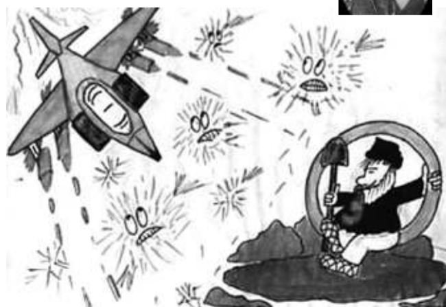
А вот таким детским «видением» браздов, ямщика и кибитки делятся друг с другом пользователи Интернета