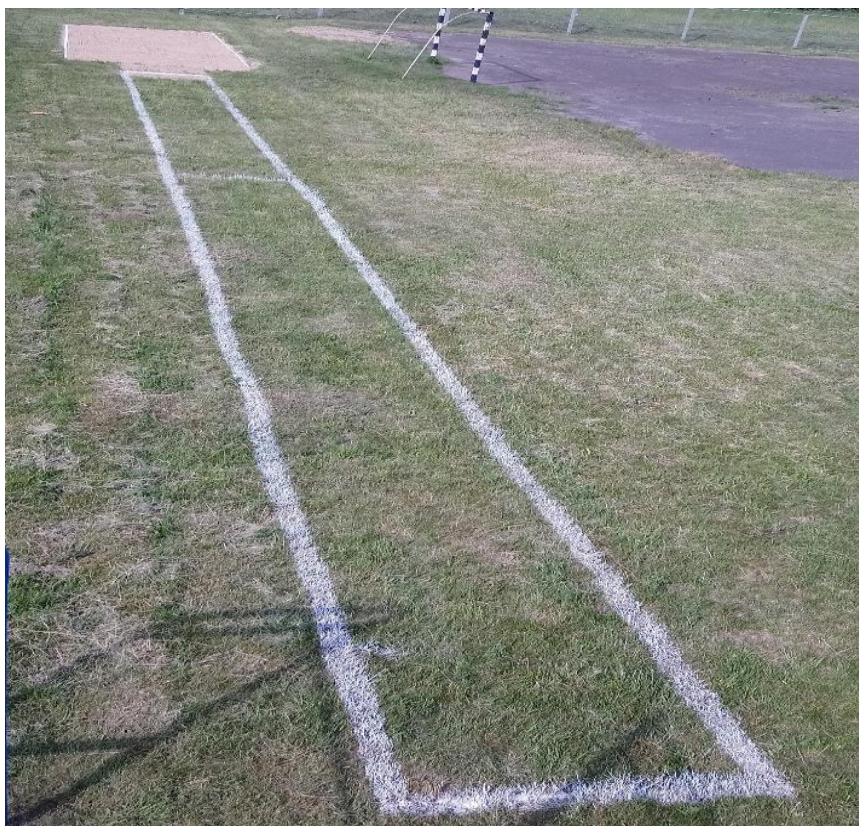
Спортивный городок (80 м x 10 м, общая протяжённость)